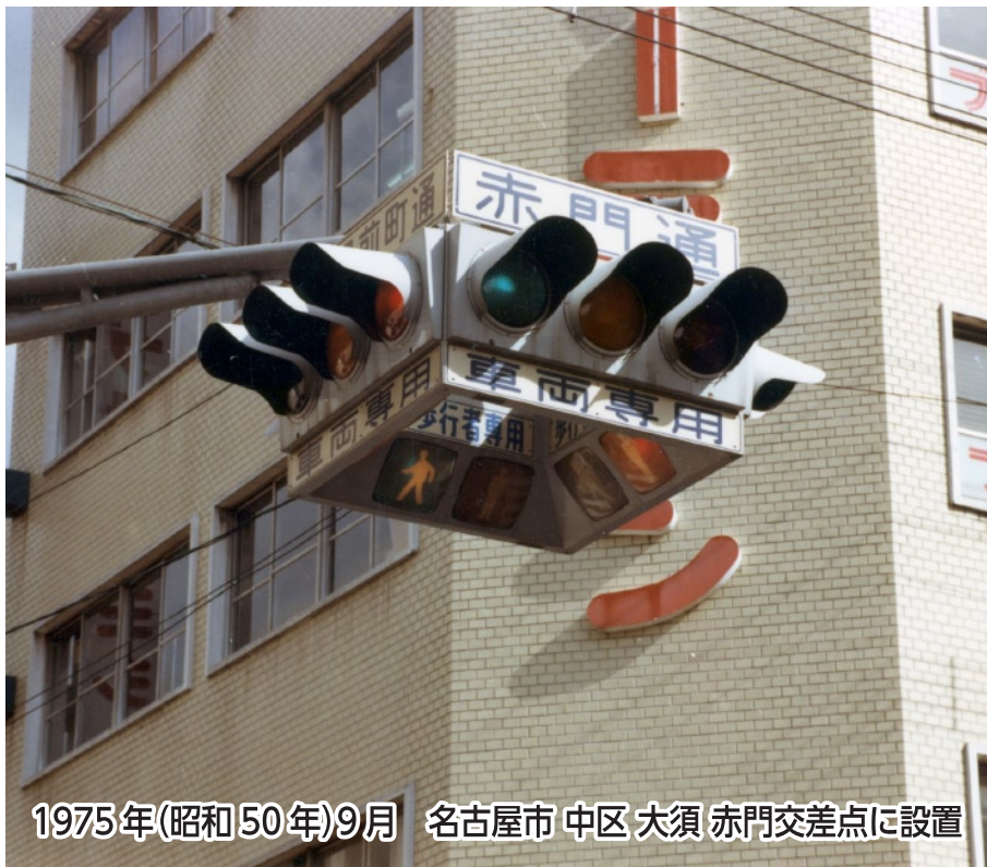
1975年(昭和50年)9月 名古屋市中区大須赤門交差点に設置